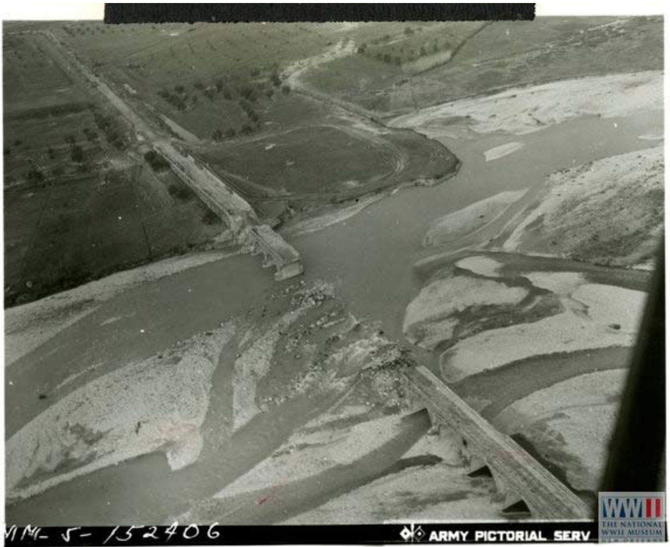
Il Ponte 25 archi fatto saltare in aria dai tedeschi in ritirata e ripristinato dagli alleati con un ponte Bailey (gennaio 1944)